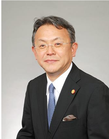
副所長弁理士 修士(法学) 元特許庁商標課長