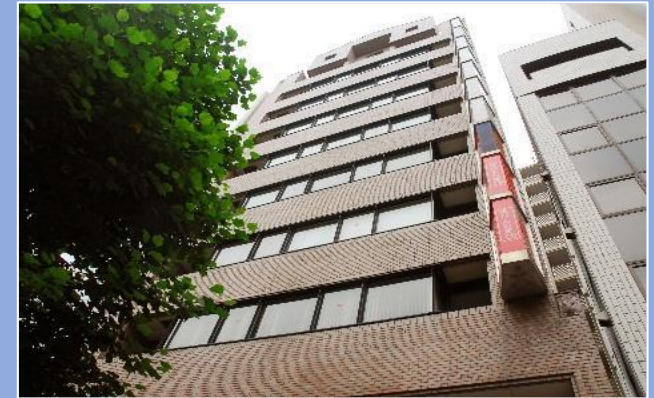
東京四谷オフィス（メインオフィス）