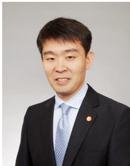
副所長弁理士 特定侵害訴訟代理業務付記 米国パテントエージェント合格