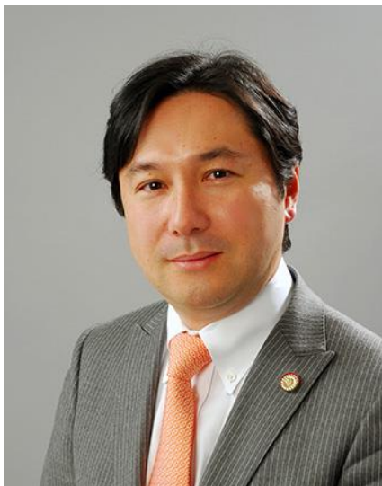
所長弁理士 修士(工学) 知財戦略コンサルタント 元弁理士会副会長